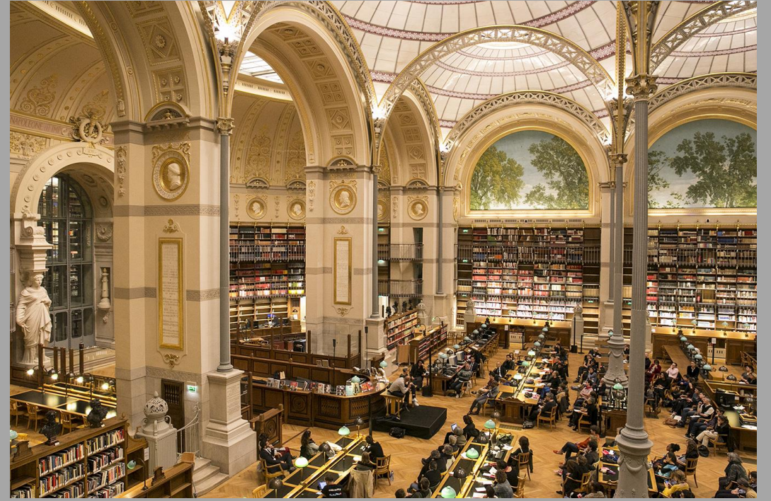
Bibliothèque de l'Institut national d'histoire de l'art (INHA)