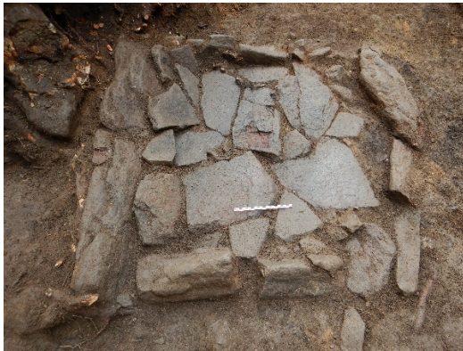
Foyer aménagé Fo B2.356 (14 C : 1046-1084 ap. JC).

La campagne 2023 viendra clore l'opération triennale avec la fouille de l'aire centrale, d'un bâtiment barlong et du système de clôture du site mais également la mise en évidence d'une probable structure hydraulique.