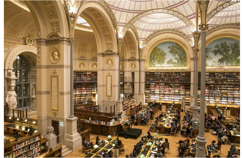
Bibliothèque de l'Institut national d'histoire de l'art (INHA)